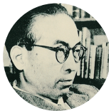
近衛秀磨 ▼ 近衛秀磨筆の母校校楽譜