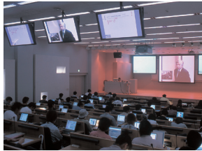
▲マルチメディアホール

正門の正面に建つ西館。1階部分は通り抜けができて、キャンパスへのメインアプローチとなっています。一般教室、情報科学部、理工学部経営システム工学科の研究実験室、1階にはHOSEIミュージアム小金井サテライト、GBC(情報科学部のオフィスアワーセンター)、地下1階に130人収容のマルチメディアホールが配置されています。