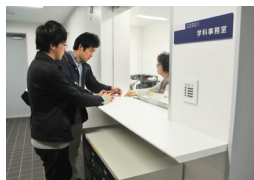
▲創生科学科事務室窓口

西館をくぐりぬけて、左手に見えてくるのが中央館です(入口が2階となります)。理工学部創生科学科の研究実験室が配置されています。