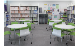
▲キャリアセンター

ゼミ室、スタディールームの他、理工学部機械工学科、電気電子工学科の研究実験室、1階には2層吹抜けの大型実験室が並びます。